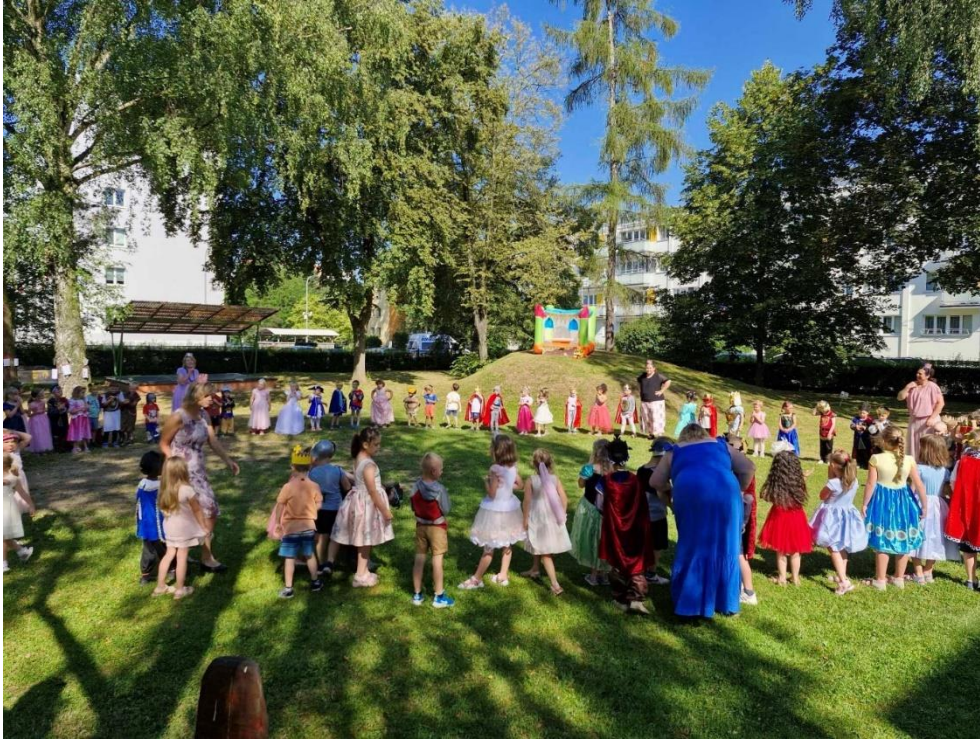
Pohádkový tým MŠ Pastelka - pedagogové