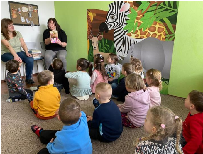
Obrázek: Návštěva knihovny Polabiny

I v letošním roce připravila MŠ stezky pro děti a širokou veřejnost v lokalitě Polabiny. Využívali jsme nabídky Knihovny, ZUŠ v městském obvodu.