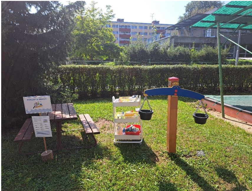
Obrázek: Komunitní kruh ve venkovním prostředí, Podnětné prostředí CA Velké kostky ve třídě, CA pokusy a objevy v prostředí zahrady