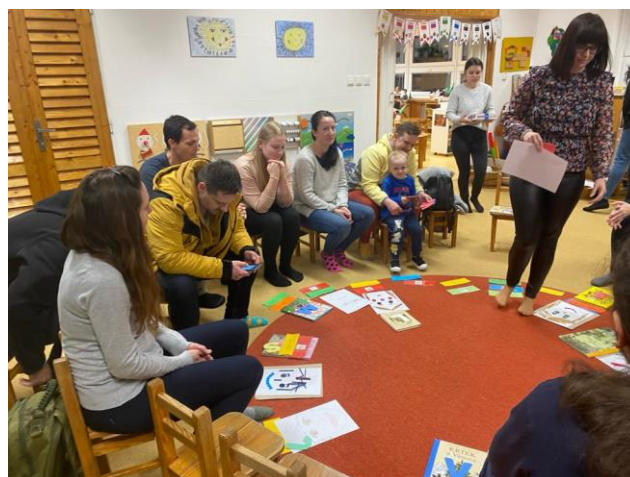
Obrázek: Začít Spolu na vlastní kůži

Nepedagogové se vzdělávali v oblasti nových trendů ve vaření a uplatňování zdravé výživy ve stravovacím procesu MŠ. Zkušenosti ze vzdělávacích akcí byly sdíleny v rámci celého týmu MŠ.