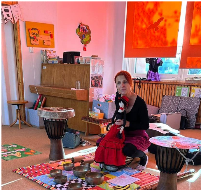
Obrázek : Muzikoterapie pro dospělé

Komentář: V letošním školním roce jsme se zapojili do projektu Psychologové do školek Lentilka. Docházelo k návštěvám psychologa přímo ve třídě MŠ a následným konzultacím s pedagogy. Tato spolupráce byla velkým přínosem zejména pro pedagogy. I nadále jsme spolupracovali v oblasti stravování v projektu Máme to na talíři – postupné zavádění potravin nových kategorií v souladu s připravovanou novelizací spotřebního koše. Pro celkové pozitivní klima na pracovišti byl zařazen program pro všechny zaměstnance muzikoterapie – předcházení vyčerpání, stresu, syndromu vyhoření.