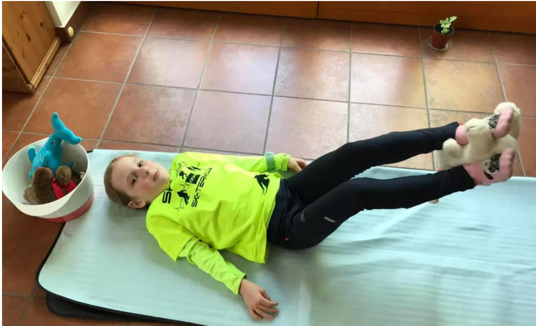
plyšáky za hlavu do kyblíčku